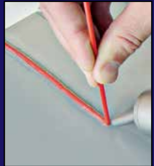
Soldadura por empuje