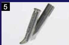
5 Boquilla de soldadura rápida, triángulo, 7 mm