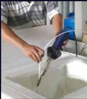
Fabricación de plástico