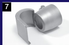
7 Boquilla reflectora