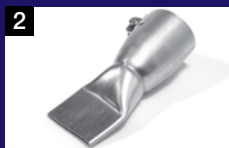
2 Amplia boquilla con ranura 40 mm