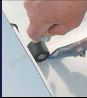
Fabricación de tejados