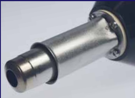
Protección del tubo calentador para mayor seguridad