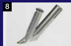
8 Boquilla de soldadura rápida 5 mm