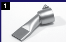
1 Amplia boquilla con ranura 20 mm