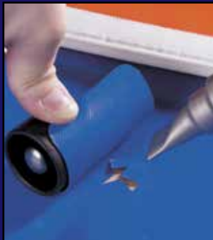
Soldadura de un parche en una lona