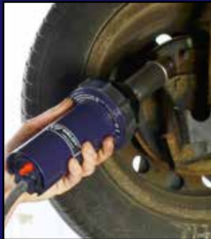
Reparación de automóviles