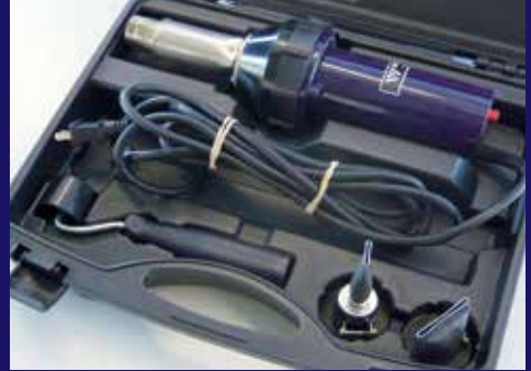
Estuche resistente para un almacenamiento sencillo (incluido en la compra).