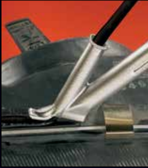
Fabricación de plástico