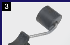
3 Cilindro de presión