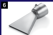
6 Amplia boquilla con ranura 70 mm