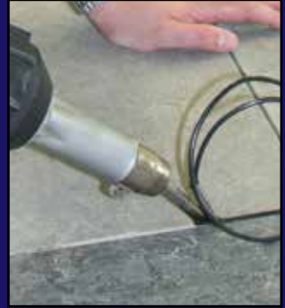
Revestimiento de suelos