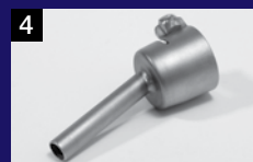
4 Boquilla tubular 5 mm