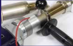
Varillas de soldadura fáciles de insertar a ambos lados para facilitar posturas de soldado más flexibles