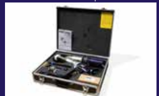
Robusto maletín para un almacenamiento ordenado y sin polvo (incluido en la compra)