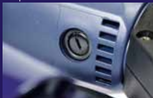
Escobilla de carbón fácil y rápida de cambiar