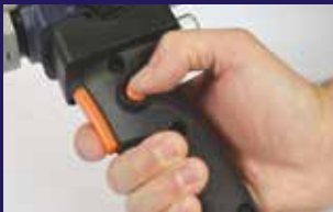
Botones de bloqueo para una soldadura de extrusión continua con poco esfuerzo