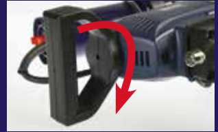
Mango giratorio para una ergonomía mejorada