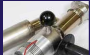
Mango y reguladores extraíbles a ambos lados para ayudar a mantener su herramienta más limpia