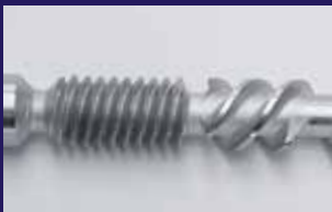
Tornillo de alta calidad para una vida útil más larga