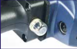
Protección visible contra las sobrecargas para un mayor control