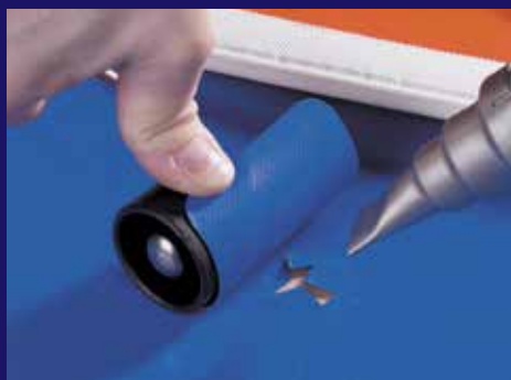
Soldadura con parche u otros trabajos de reparación